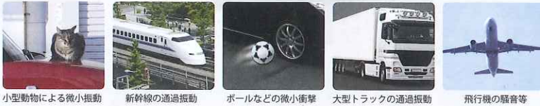
小型動物による微小振動 新幹線の通過振動 ボールなどの微小衝撃 大型トラックの通過振動 飛行機の騒音等

これまでのセキュリティーが誤動作を起こしていたシーンを徹底的に検証し、異常検知レベルを見分け誤動作回避を実現しました。